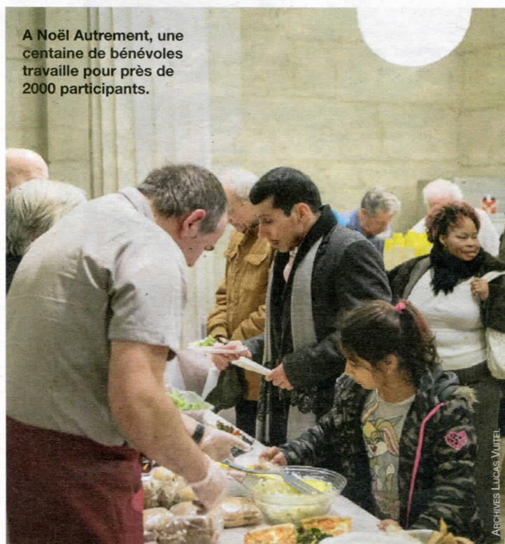
A Noël Autrement, une centaine de bénévoles travaille pour près de 2000 participants.